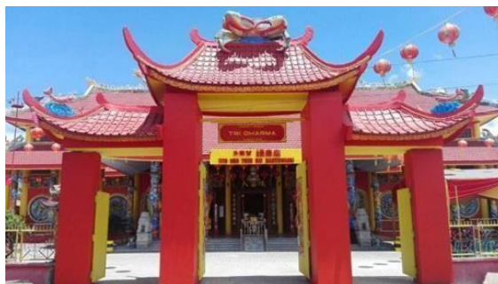
Gambar 1. Pintu masuk Utama Klenteng Hoo Tong Bio

Klenteng Hoo Tong Bio, yang didirikan pada tahun 1784, merupakan tempat ibadah tertua bagi umat Khonghucu di Jawa Timur dan Bali. Terletak di Karangrejo, Banyuwangi, klenteng ini dibangun sebagai penghormatan kepada Tan Hu Cin Jin, seorang kapten yang menyelamatkan komunitas dari kolonialisme Tionghoa Belanda. Klenteng ini tidak hanya berfungsi sebagai tempat ibadah, tetapi juga sebagai cagar budaya yang melestarikan tradisi dan ritual etnis Tionghoa yang juga digunakan menjadi pusat pembelajaran bahasa mandarin. Setelah mengalami kebakaran pada tahun 2014, klenteng ini telah berevolusi dan tetap menjadi daya tarik wisata ( Klenteng Hoo Tong Bio Di Banyuwangi Ludes Terbakar , 2014).