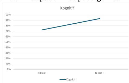
Gambar 1.2 Peningkatan Hasil Belajar Kognitif

Hasil belajar siswa ranah kognitif mengalami peningkatan di mulai dari siklus I hingga ke siklus II. Peningkatan hasil belajar siswa ranah kognitif ditunjukkan dengan bertambahnya jumlah siswa yang mendapatkan nilai tuntas setelah dilakukan tindakan kelas baik pada tindakan siklus I maupun siklus II. Persentase kenaikan ketuntasan yang diperoleh pada siklus I dan siklus II dapat dilihat pada gambar 1.2. sebagai berikut :